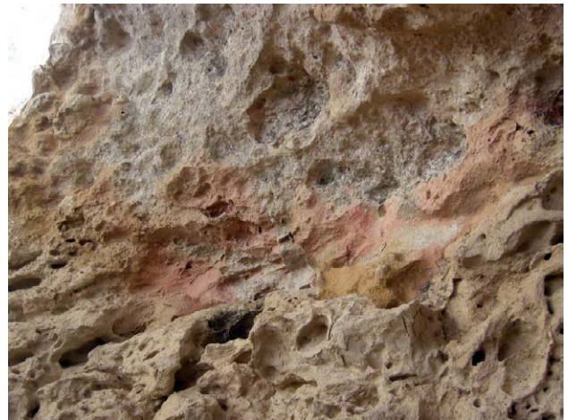
Рис. 2. Участки налета розового цвета в гроте Белоголовых Сипов.