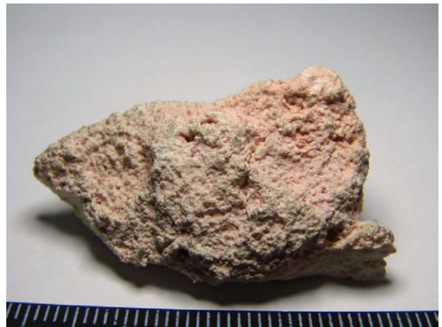
Рис. 3. Образец 2-BS-Kachi.