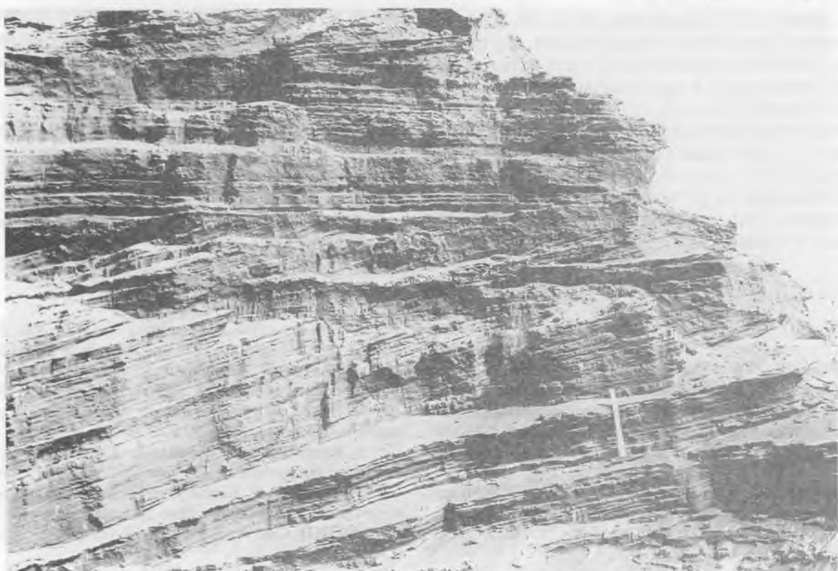
Рис. 4. Эгинсайские пески (вверху и внизу) с обычным для разреза Кушмурун направлением наклона косої слоистости