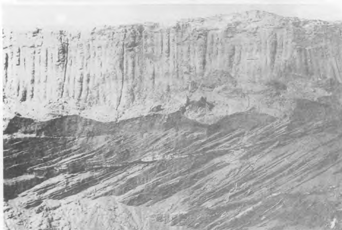
Рис. 2. Общий вид бурогоугольного карьера «Приозерный»: вверху в дне карьера — юрские угленосные отложения, в основании стенки карьера — верхние их горизонты, выше — кампан, эгинсайская свита, по [16, рис. 3, слой 3—5], еще выше — маастрихт, журавлевская свита (слой 6—9), для масштаба на снимке слева вверху — экскаватор; внизу — косослоистые пески эгинсайской свиты и отложения журавлевской свиты со следами ковша экскаватора