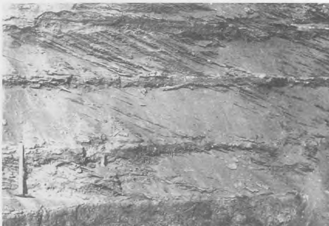
Рис. 3. Контакт косослоистых песков эгинсайской свиты и песчано-гравийно-галечниковых отложений основания журавлевской свиты (вверху) и участок основания эгинсайских песков, в которых направление наклона косой слоистости отличается от преобладающего в их толще (внизу) (см. рис. 4)