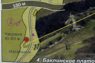
4. Баклинское плато