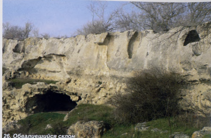
26. Обвалившийся склон