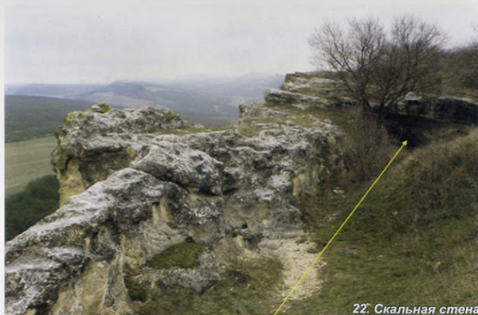
22. Скальная стена