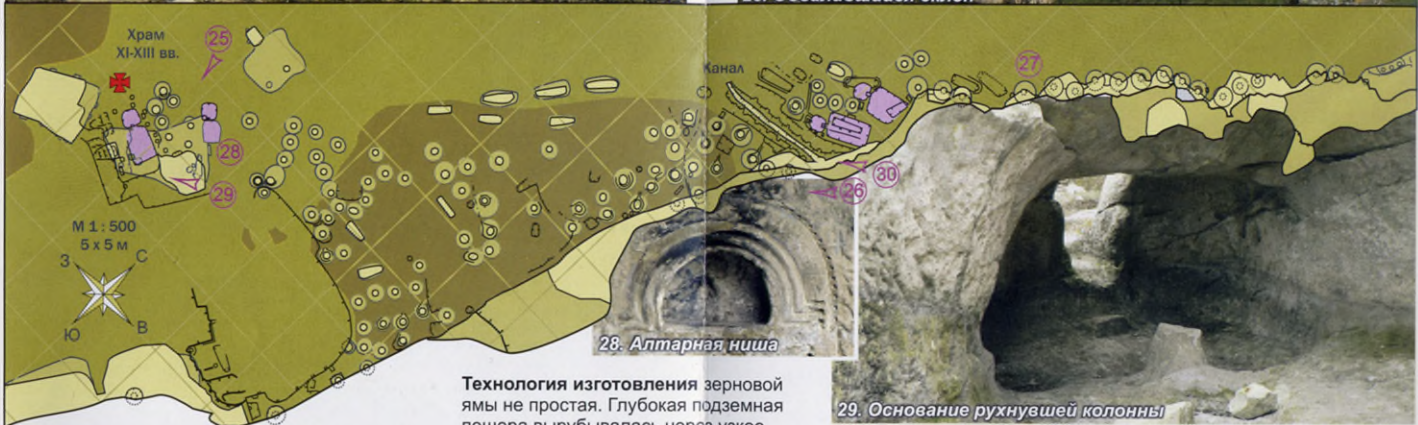
28. Алтарная ниша