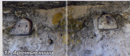
17. Арочные ниши

Комплекс из трех пещер, соединенных переходами, находится справа по коридору. В потолках этих хорошо сохранившихся помещений светятся отверстия от люков и горловин зерновых ям. Зачем эти дыры? Чтобы ссыпать зерно сверху, а не обносить его к нижнему входу? Но ведь для этого достаточно и одного отверстия. Вероятнее всего, вначале здесь были группы отдельных зерновых ям (горловины) и подземных кладовок (люки), которые впоследствии были объединены и расширены в просторные пещеры. Свидетельством этому служит «квартет» частично сохранившихся зерновых ям в потолке крайней пещеры. В стенах пещер много неглубоких скругленных арочных ниш.