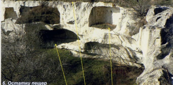
6. Остатки пещер