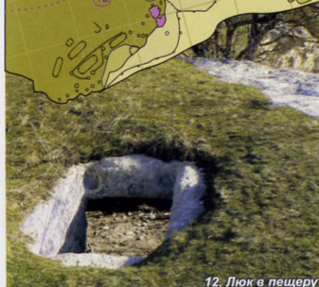
12. Люк в пещеру

Небольшой «пятячок» на выступе плато весь изрыт искусственными выемками. Кроме четырех могил привлекает внимание группа мелких круглых углублений, соединительных канавок и две смежные ванны различной глубины, которые могли использоваться для выдавливания сока из ягод. Скорее всего, здесь был единый винодельческий комплекс, территория которого после запустения города начала использоваться для захоронений.