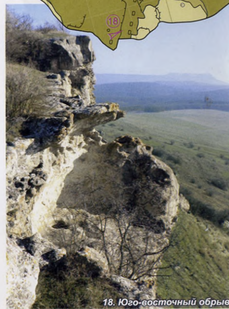
18. Юго-восточный обрыв

На крайней самой высокой площадке южного склона выбит ряд больших прямоугольных углублений. Здесь могла быть наблюдательная башня города. В юго-восточном обрыве плато видны остатки пещер, а неподалеку отвесное скальное возвышение с вырубками – южный край цитадели.