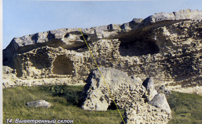
14. Выветренный склон