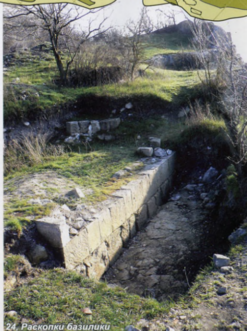
24. Раскопки базилики