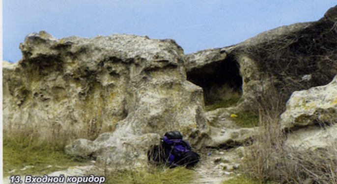
13. Входной коридор