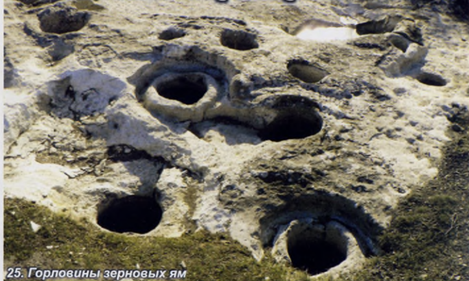
25. Горловины зерновых ям