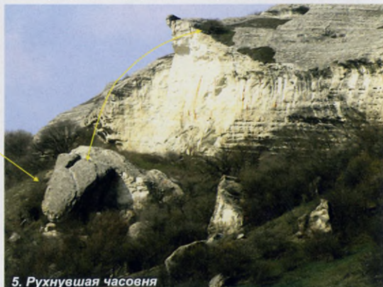
5. Рухнувшая часовня

На верхней террасе над могильником была вырублена пещерная часовня, функционировавшая до XIV века. В декабре 1997 года произошло естественное обрушение выступа скалы, помещение часовни упало на нижнюю террасу, перевернулось и теперь обращено входом вверх.