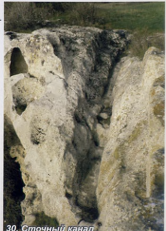
30. Сточный канал

Ушла вода, ушла и жизнь? Это тоже может быть причиной того, что развитый город, не один раз вставший в войнах и не раз восставший из разрухи, был навсегда оставлен людьми.