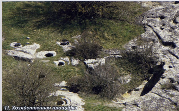
11. Хозяйственная площадка