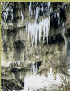
3. Баклинский источник

Уединенность Баклы и доступность ее территории вряд ли делали ее стратегически важной крепостью, но, без сомнения, здесь был центр большой средневековой общины, объединявшей жителей всех соседних долин.