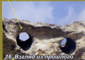
16. Взгляд из прошлого