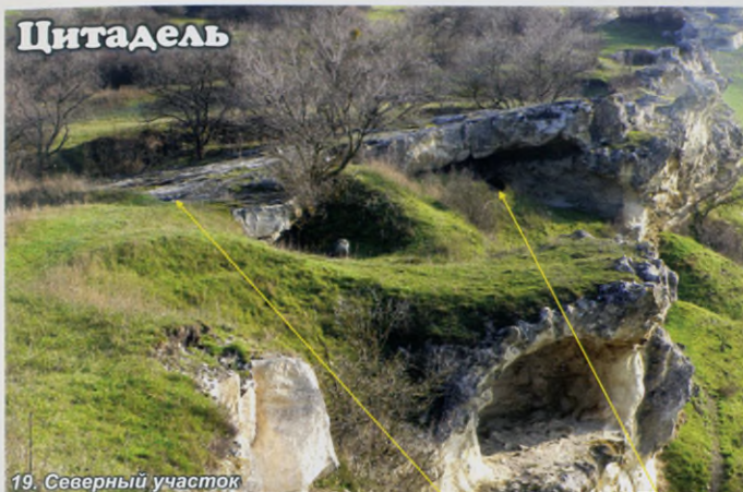
19. Северный участок